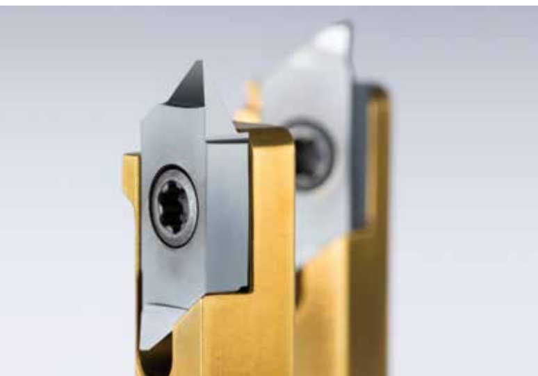
Die Schneiden sind mit besonders hoher Sorgfalt geschliffen.