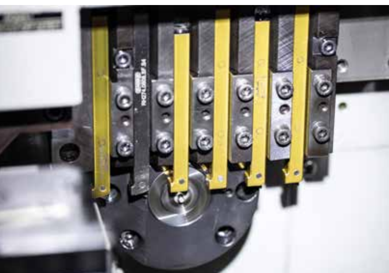
Die Werkzeugträger aus Schwermetall sorgen für eine gute Schwingungsdämpfung.

absolut scharf geschliffen und die Werkzeughalter schwingungsarm sind“, erklärt Alain Kiener, Produktionsleiter bei Laubscher. Des Weiteren spielt die Schartigkeit beziehungsweise die Schnittigkeit der Schneidkanten eine entscheidende Rolle in der Mikrobearbeitung. Jede Unregelmäßigkeit auf der Schneidkante spiegelt sich auf dem Werkstück wider.