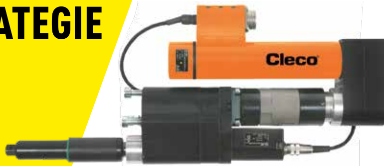
Werkzeuge für den professionellen Einsatz. Die Einbau-Schraubspindel von Cleco.