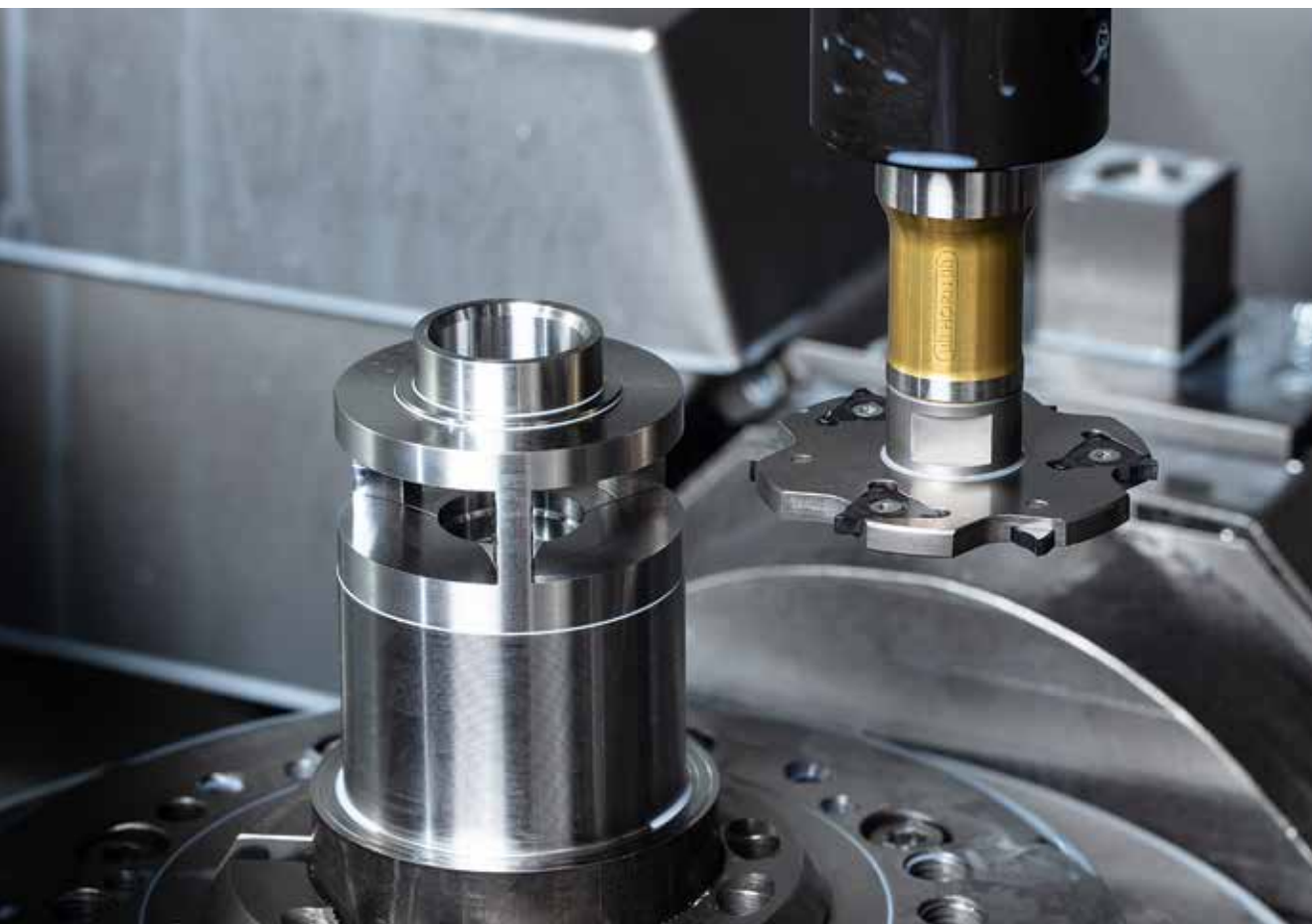
Nutfräsen mit dem System M310.

Hierzu setzt Neukamm auf das HORN-Frässystem M310 mit einem Schneidkreis von 63 mm und sechs Schneiden. „Durch den Wechsel auf den Scheibenfräser von HORN konnten wir die Vorschubgeschwindigkeit von früher 280 mm/min auf nun 400 mm/min erhöhen. Des Weiteren erhöhte sich die Standzeit, und das Fräsgeräusch klingt nun viel runder“, sagt Neukamm. Das Werkzeug fährt zum Fräsen der Nut auf einer Kreisbahn. Die 20 mm breite Nut fräst der Scheibenfräser in vier Schnitten. Bestückt ist das HORN-Frässystem mit dreischneidigen Wendeschneidplatten des Typs 310. „Wir sind mit dem Frässystem sehr zufrieden. Es ist preislich nicht günstig,