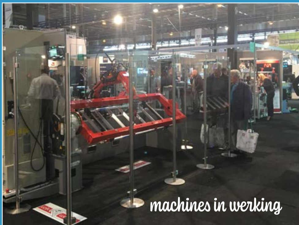
machines in werking

Bedankt voor je aandacht en tot de volgende MetaVak.