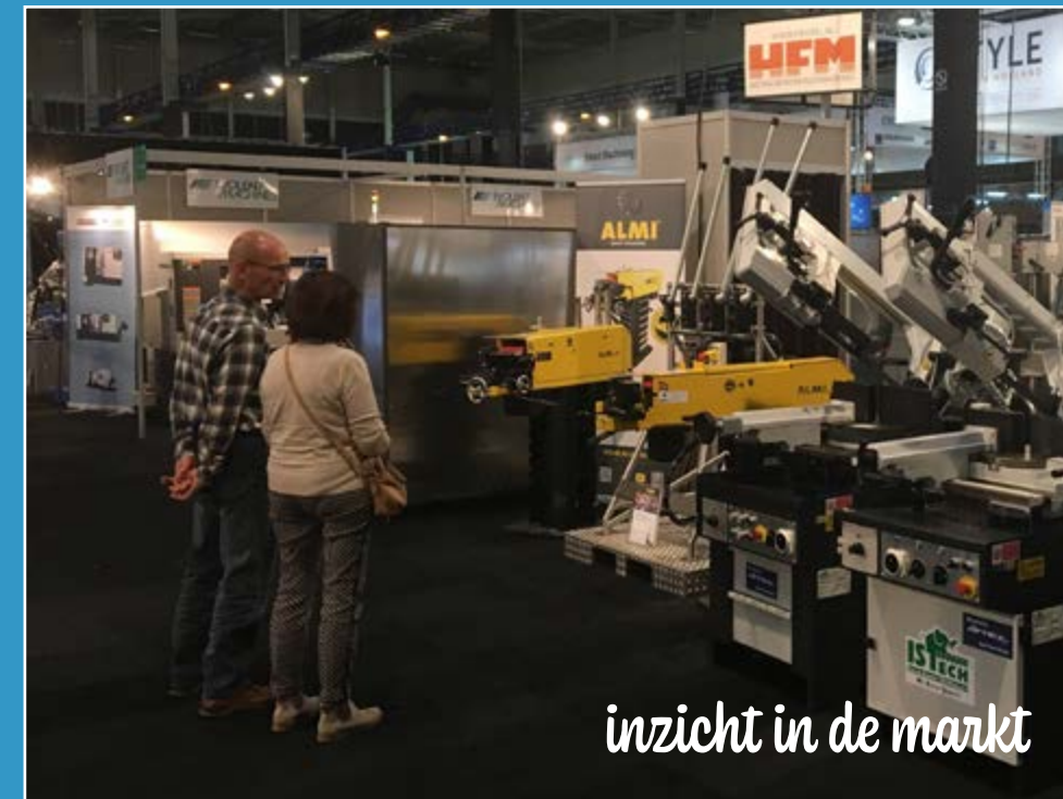
inzicht in de markt