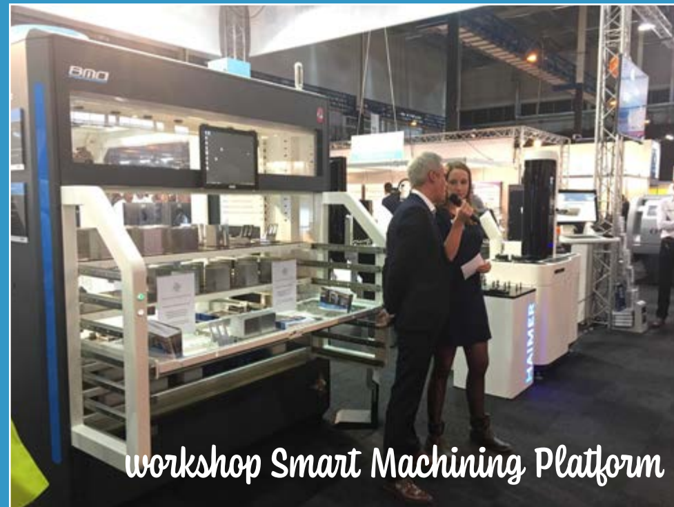
workshop Smart Machining Platform