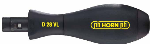
D 28 VL 2-7 Nm

Einstellwerkzeug für Drehmoment-Schraubendreher