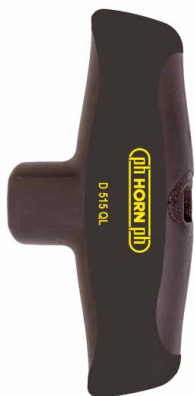
D515QL 5-14 Nm